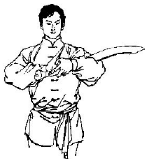
Abb. 2: Gruss mit Säbel : Aufrechter Stand, Füße geschlossen, Säbel in der linken Hand gehalten, linker Arm im Ellbogen gebeugt, sodass der Säbel quer vor der Brust liegt mit der scharfen Klingenseite nach oben, das erste Gelenk des linken Daumens berührt das Zentrum der rechten Handfläche. Beide Hände sind ca. 20-30 cm von der Brust entfernt