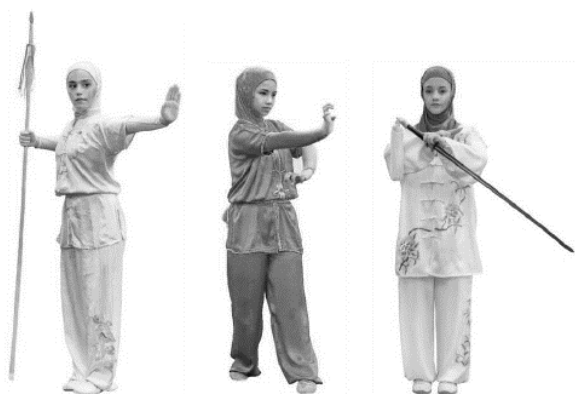
Abb.: Klassische Wettkampfbekleidung mit zusätzlicher islamischer Ergänzung

Nicht erlaubt sind Clubbekleidung und herkömmliche Trainingsbekleidung