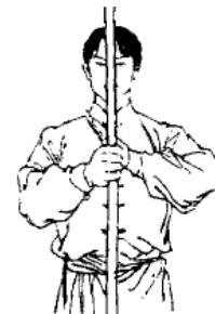
Abb. 4: Gruss mit Speer oder Stock : Aufrechter Stand, Füße geschlossen, beide Arme vor der Brust im Ellbogen gebeugt, die Waffe wird aufrecht in der rechten Hand, ca. ein Drittel vom Stockende gehalten, während die linke Handfläche auf dem zweiten Gelenk des rechten Daumens platziert wird. Beide Hände sind ca. 20-30 cm von der Brust entfernt