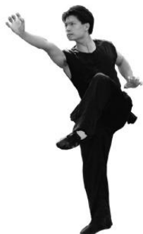
Abb. 1: Klassische Wettkampfbekleidung für Nanquan (Kurzarm)

Erlaubt ist Wettkampfbekleidung im klassischen chinesischen Stil (kragenlos, sieben Knöpfe, ärmellos für Männer, kurze Ärmel für Frauen), sowie Kleider im modernen Stil, wie sie an Wettkämpfen des Internationalen Wushu-Verbandes (IWuF) erlaubt sind. Nicht erlaubt sind Clubbekleidung und herkömmliche Trainingsbekleidung.