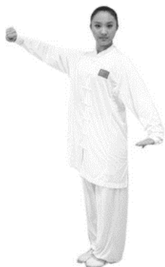
Abb.: Klassische Wettkampfbekleidung für Taijiquan (Langarm)

Erlaubt ist Wettkampfbekleidung im klassischen chinesischen Stil (aufrechter Kragen, sieben Knöpfe, lange Ärmel), sowie Kleider im modernen Stil, wie sie an Wettkämpfen des Internationalen Wushu-Verbandes (IWuF) erlaubt sind. Nicht erlaubt sind Clubbekleidung und herkömmliche Trainingsbekleidung