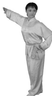
Abb. 2: Klassische Wettkampfbekleidung für Changquan (Langarm)