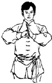
Abb. 1: Faust-Handflächen-Gruss : Aufrechter Stand, Füße geschlossen, rechte Faust mit den Knöcheln gegen die aufgerichtete linke Handfläche, vor dem Körper und ca. 20-30 cm von der Brust entfernt.

Vor dem Betreten des Teppichs und nach Bekanntgabe der Endnote hat der Athlet den Hauptschiedsrichter mit dem Hand-Faust-Gruss zu grüssen. In Waffenformen kommt eine modifizierte Form desselben zum Tragen.