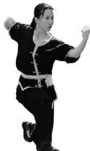
Abb. 2: Klassische Wettkampfbekleidung für Nanquan (Frauen)