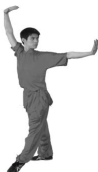
Abb. 1: Klassische Wettkampfbekleidung für Changquan (Kurzarm)

Nicht erlaubt sind Clubbekleidung und herkömmliche Trainingsbekleidung