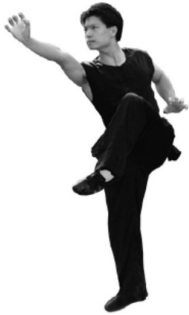
Abb. 1: Klassische Wettkampfbekleidung für Nanquan (Kurzarm)

Erlaubt ist Wettkampfbekleidung im klassischen chinesischen Stil (kragenlos, sieben Knöpfe, ärmellos für Männer, kurze Ärmel für Frauen), sowie Kleider im modernen Stil, wie sie an Wettkämpfen des Internationalen Wushu-Verbandes (IWuF) erlaubt sind. Nicht erlaubt sind Clubbekleidung und herkömmliche Trainingsbekleidung.