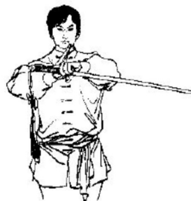
Abb. 3: Gruss mit Schwert : Aufrechter Stand, Füße geschlossen, Schwert in der linken Hand gehalten, linker Arm im Ellbogen gebeugt, sodass die Klinge quer vor der Brust und nahe der Aussenseite des Unterarms liegt, die Ulnarseite der rechten Handfläche am Grundgelenk des linken Zeigefingers. Beide Hände sind ca. 20-30 cm von der Brust entfernt