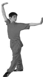
Abb.1: Klassische Wettkampfbekleidung für Changquan (Kurzarm)

Nicht erlaubt sind Clubbekleidung und herkömmliche Trainingsbekleidung