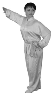
Abb.2: Klassische Wettkampfbekleidung für Changquan (Langarm)