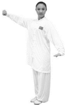
Abb.: Klassische Wettkampfbekleidung für Taijiquan (Langarm)

Erlaubt ist Wettkampfbekleidung im klassischen chinesischen Stil (aufrechter Kragen, sieben Knöpfe, lange Ärmel), sowie Kleider im modernen Stil, wie sie an Wettkämpfen des Internationalen Wushu-Verbandes (IWuF) erlaubt sind. Nicht erlaubt sind Clubbekleidung und herkömmliche Trainingsbekleidung