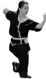
Abb. 2: Klassische Wettkampfbekleidung für Nanquan (Frauen)