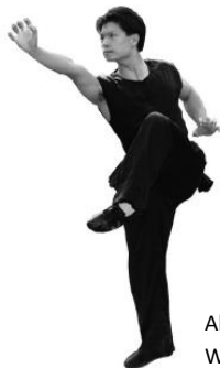
Abb. 6a: Klassische Wettkampfbekleidung für Nanquan

Nicht erlaubt sind Clubbekleidung und herkömmliche Trainingsbekleidung.