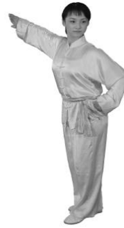
Abb. 5b: Klassische Wettkampfbekleidung für Changquan (Langarm)