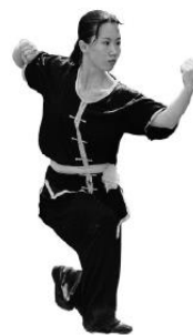
Abb. 6b: Klassische Wettkampfbekleidung für Nanquan (Frauen)