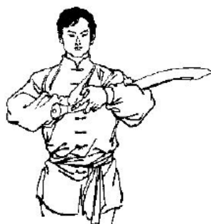
Abb. 2: Gruss mit Säbel: Aufrechter Stand, Füße geschlossen, Säbel in der linken Hand gehalten, linker Arm im Ellbogen gebeugt, sodass der Säbel quer vor der Brust liegt mit der scharfen Klingenseite nach oben, das erste Gelenk des linken Daumens berührt das Zentrum der rechten Handfläche. Beide Hände sind ca. 20-30 cm von der Brust entfernt