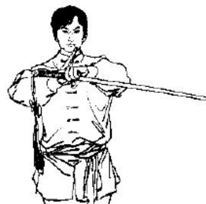
Abb. 3: Gruss mit Schwert: Aufrechter Stand, Füße geschlossen, Schwert in der linken Hand gehalten, linker Arm im Ellbogen gebeugt, sodass die Klinge quer vor der Brust und nahe der Aussenseite des Unterarms liegt, die Ulnarseite der rechten Handfläche am Grundgelenk des linken Zeigefingers. Beide Hände sind ca. 20-30 cm von der Brust entfernt