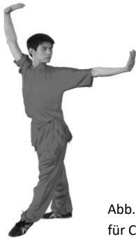
Abb. 5a: Klassische Wettkampfbekleidung für Changquan (Kurzarm)

Nicht erlaubt sind Clubbekleidung und herkömmliche Trainingsbekleidung.